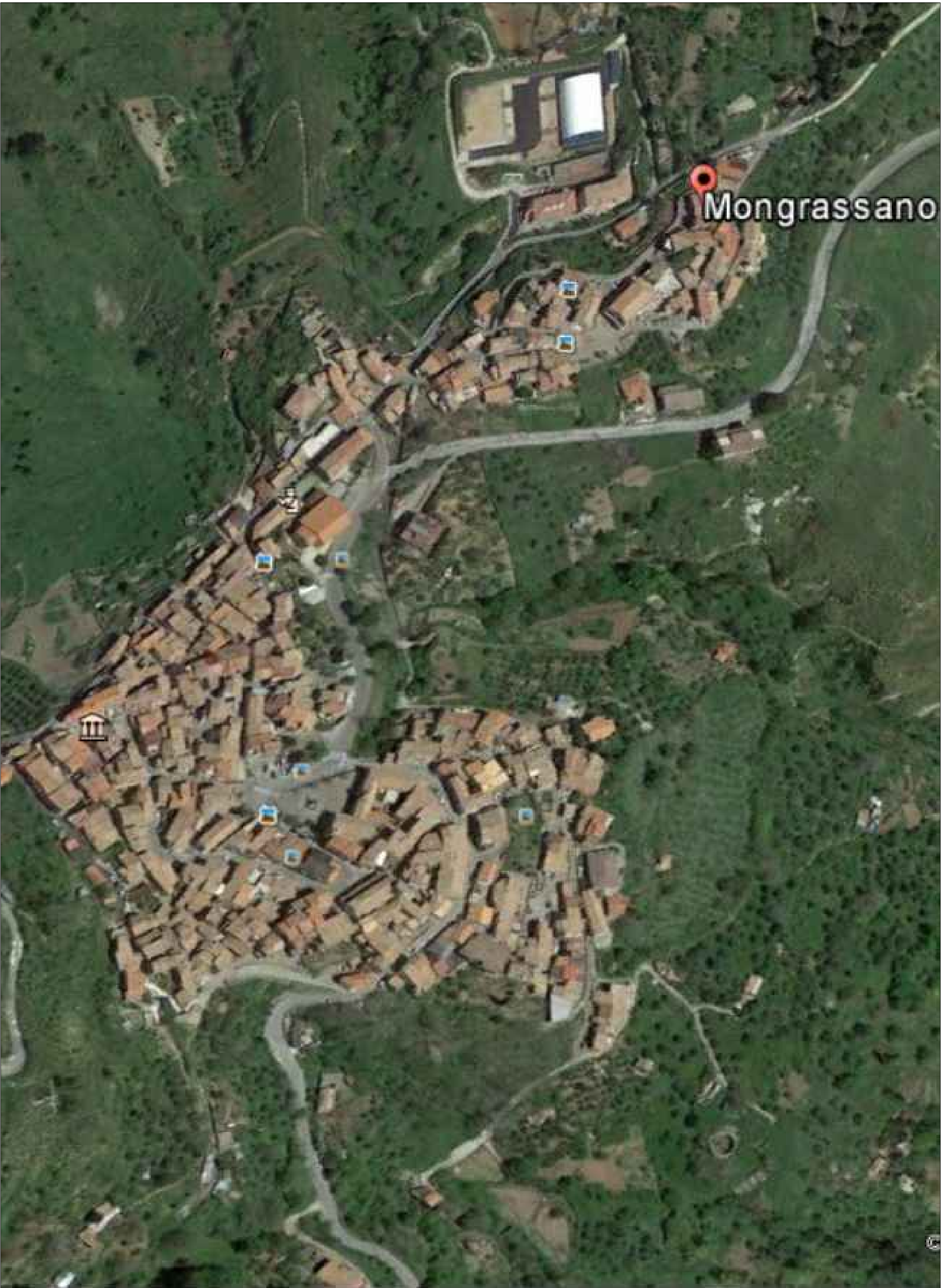
Individuazione depuratori presenti nel comune di Mongrassano